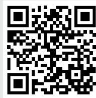
Video: ALD EXPERT EYE im Einsatz

Americas Metallurgy ALD Vacuum Technologies service-us@ald-vt.com Tel.: +1 860 386 7227