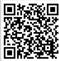
ALD Service Webpage

Otto-von-Guericke-Platz 1 63457 Hanau, Deutschland Tel.: +49 6181 307-0 E-Mail: service@ald-vt.de